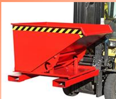
Kipper mit 3-seitiger Kippfunktion

Hier sehen Sie eine Auswahl der Kipp- und Klappbodenbehälter, die wir im Angebot haben. Die Behälter sind in verschiedenen Farben erhältlich.