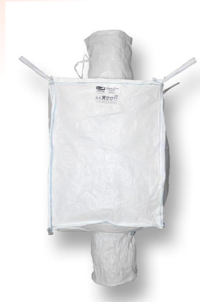
Big Bag mit Einlauf und Auslauf