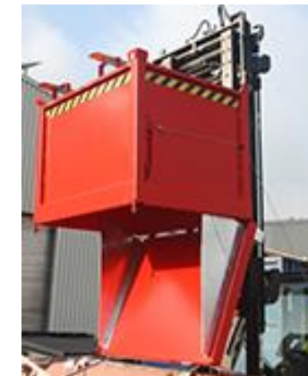
Klappbodenbehälter zum Sammeln, Lagern und Umfüllen