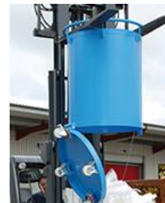
Erster Rundbehälter mit Bodenentriegelung