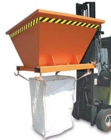
Einfüllhilfe für Big Bags