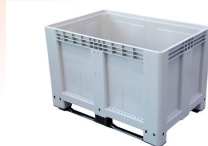
C-Box 2 (520 Liter)