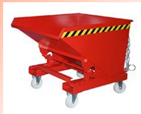
Kompakter Kipper mit Abrollsystem