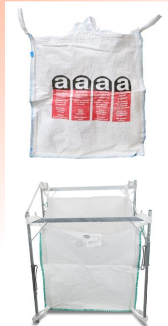
Big Bag Asbest (oben) Big Bag Halter (unten)