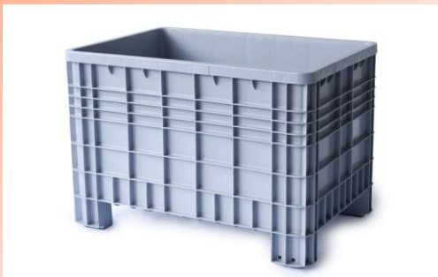
C-Box 1 (520 Liter)