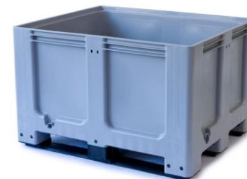
C-Box 3 (610 Liter)