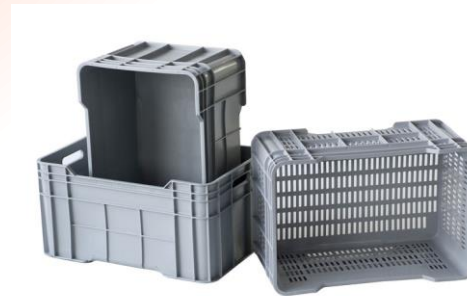
C-Box Mini (58 Liter)