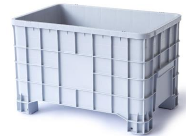
C-Box Midi (280 Liter)