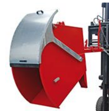
Kipper mit Runddeckel