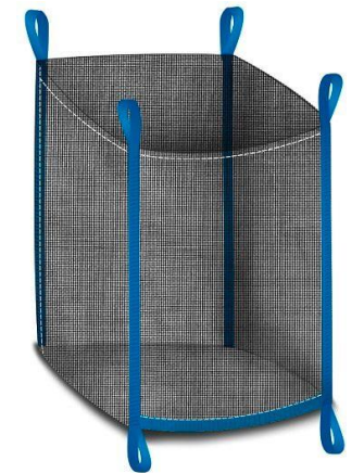
Big Bag luftdurchlässig