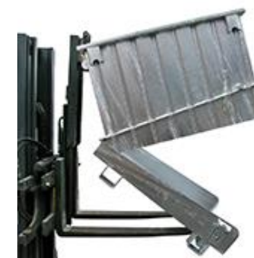
Klappboden mit dosierter Entleerung