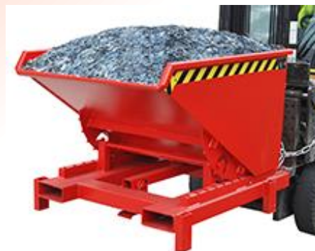
Schwerlast-Kipper mit automatischer Entriegelung